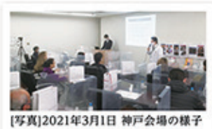
[写真]2021年3月1日 神戸会場の様子

育毛について詳しく調べ、すごく勉強になりました。各アイテムのタイプ別使い方も復習出来ました。脱毛サロンですがメンズのお客様や薄毛で悩んでいる女性のお客様もいるのでアドバイスできるようしっかり宣伝して、売上アップ頑張ります!!わくわくしてきました!!セミナー参加してよかったです。